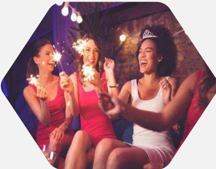
Packs para Despedidas