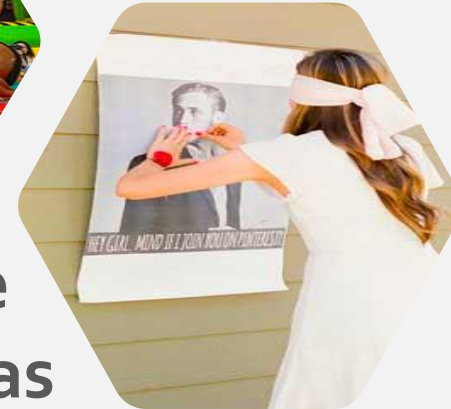
Gynkanas & Juegos