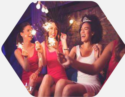
Packs para Despedidas