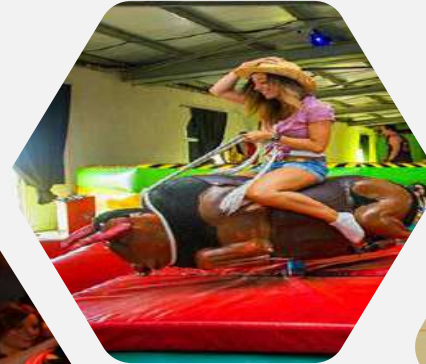
Fincas de Despedidas