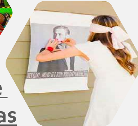
Gynkanas & Juegos