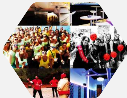
Packs para Despedidas