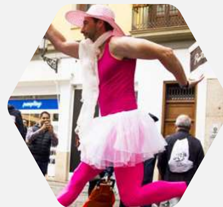
Gynkanas & Juegos