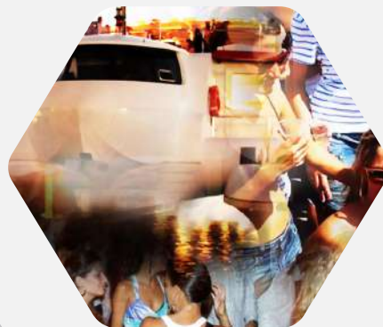
Fiestas en Barco