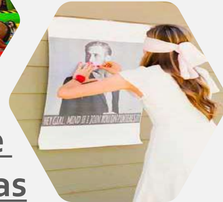
Gynkanas & Juegos