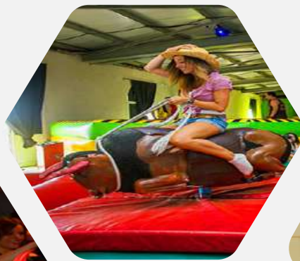
Fincas de Despedidas