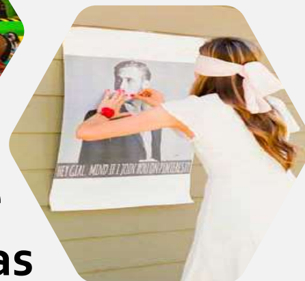
Gynkanas & Juegos