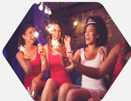
Packs para Despedidas