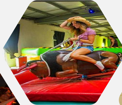
Fincas de Despedidas