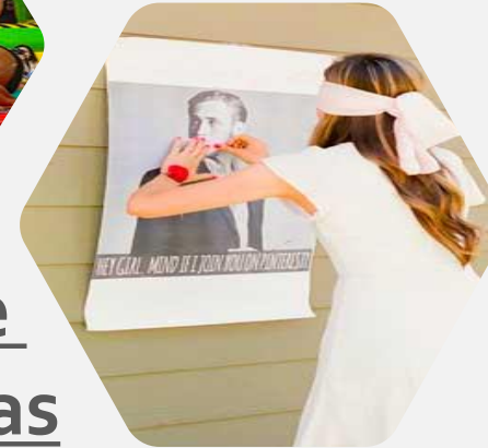
Gynkanas & Juegos